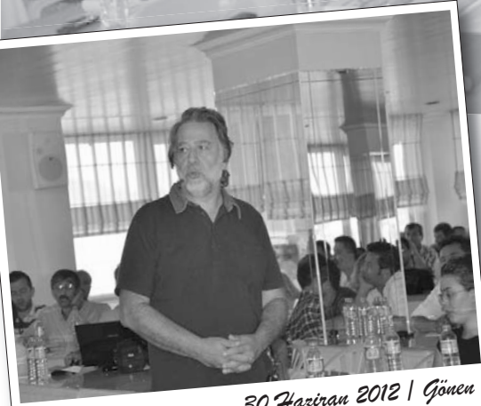
30 Haziran 2012 | Gönen