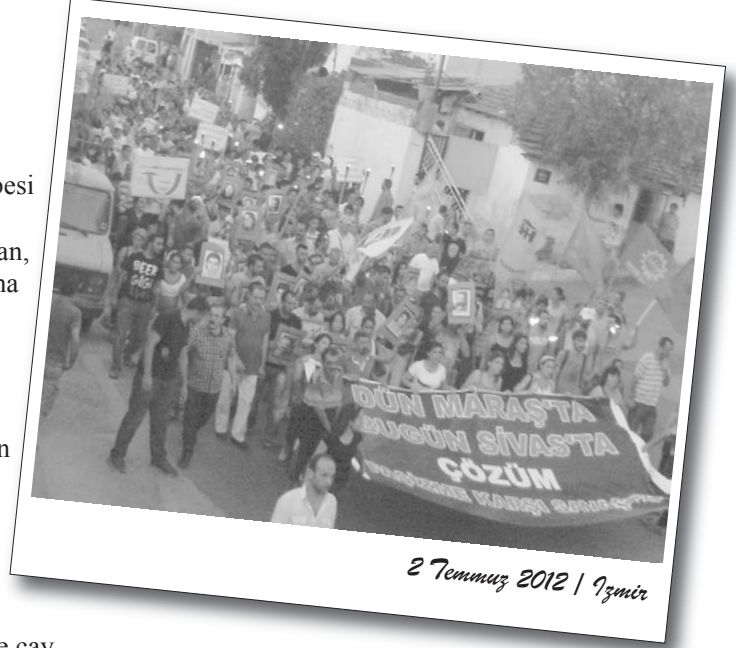
2 Temmuz 2012 | İzmir

Güzeltepe ’de Uğur Mumcu Parkı’nda toplanılmasının ardından yürüyüş başladı. Sivas’ta katledilenlerin resimleri ve meşalelerin taşındığı yürüyüş Kasaplar Meydanı’nda basın açıklamasıyla devam etti. Saygı duruşunun ardından Tekirdağ F Tipi Cezaevi’nden “Özgür Tutsaklar” adına gelen mektup okundu. Alevi Yol Kültür Derneği’nin bağlama ekibi türkülerle müzik dinletisi verdi. Bağlama ekibinden sonra Alevi Yol Kültür Derneği’nin tiyatro ekibi “Ateş Çemberi” adlı oyununu sergiledi. Alevi Yol