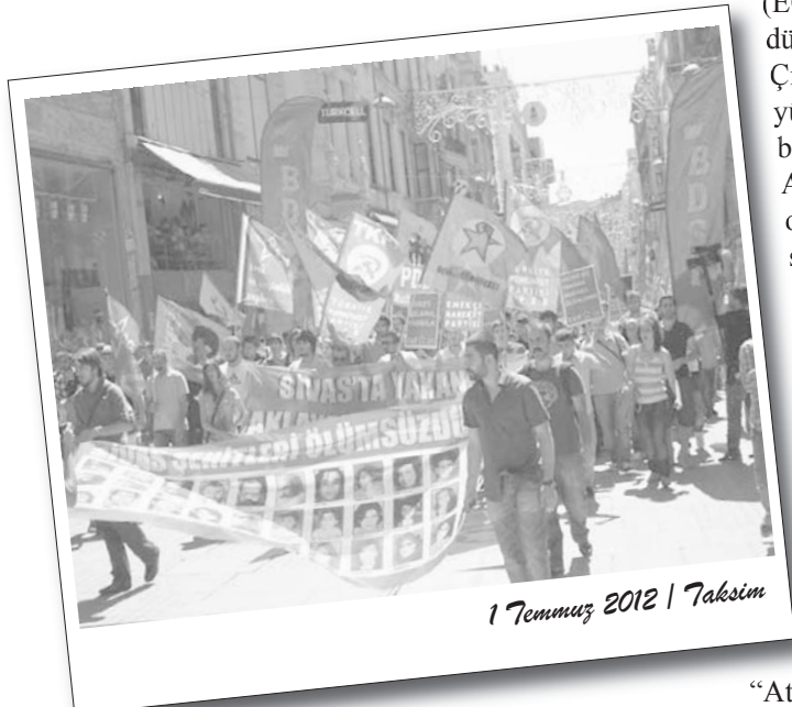
1 Temmuz 2012 | Taksim

Muğla ’da Fethiye Demokrasi Güçleri Platformu, Fethiye Kültür Merkezi’nin önünde basın açıklaması gerçekleştirdi. Sivas Katliamı’nda şehit düşenlerin resimlerinin bulunduğu pankartın açıldığı basın açıklamasında, şehitler için saygı duruşu yapıldı.