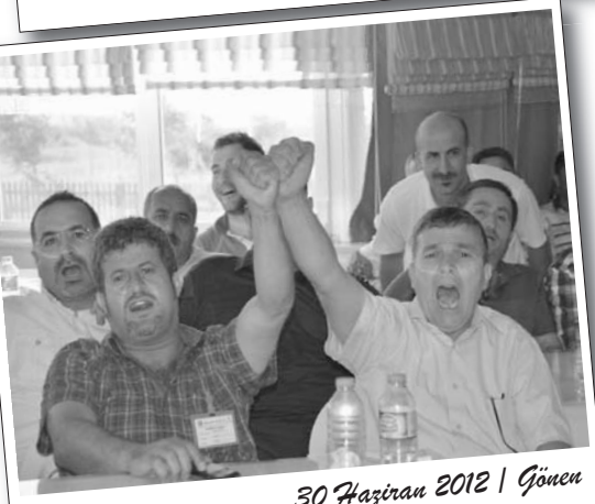
30 Haziran 2012 | Gönen

Birleşik Metal-İş Sendikası Genel Temsilciler Kurulu, 30 Haziran 2012 tarihinde Gönen Kemal Türkler Eğitim ve Tatil Sitesi'nde toplandı.